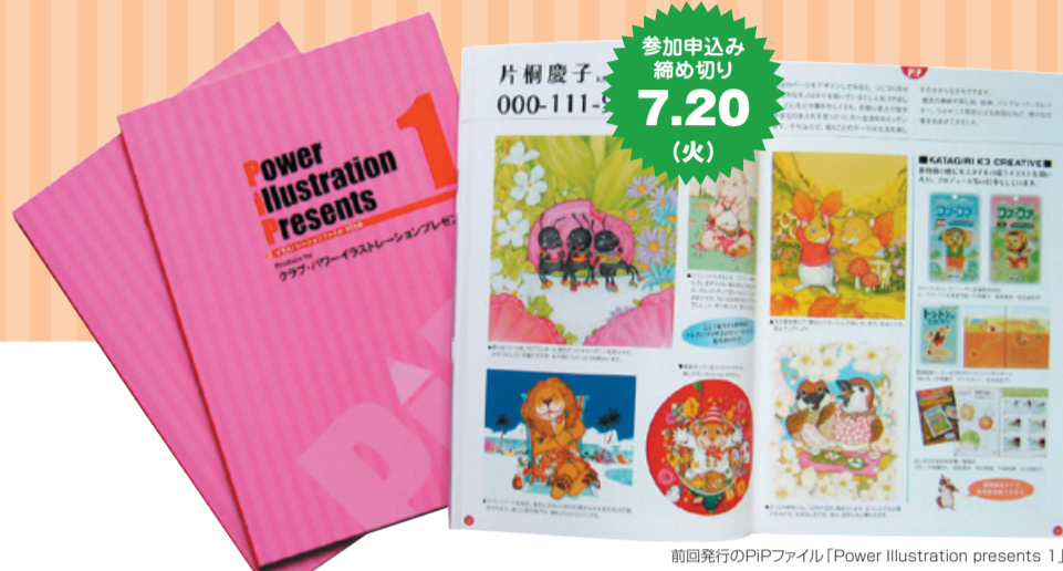
前回発行のPiPファイル「Power Illustration presents 1」